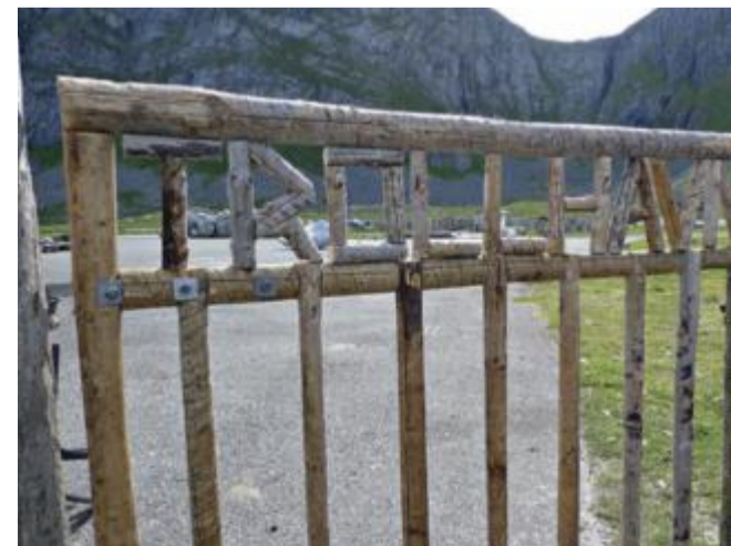
Trollhavna. Den gamle nedlagte flyplassen har fått nytt liv. Med smak av mørke hemmeligheter, uten et eneste fly.