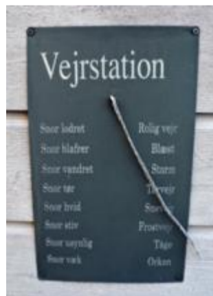
Været. En unik oppfinnelse.