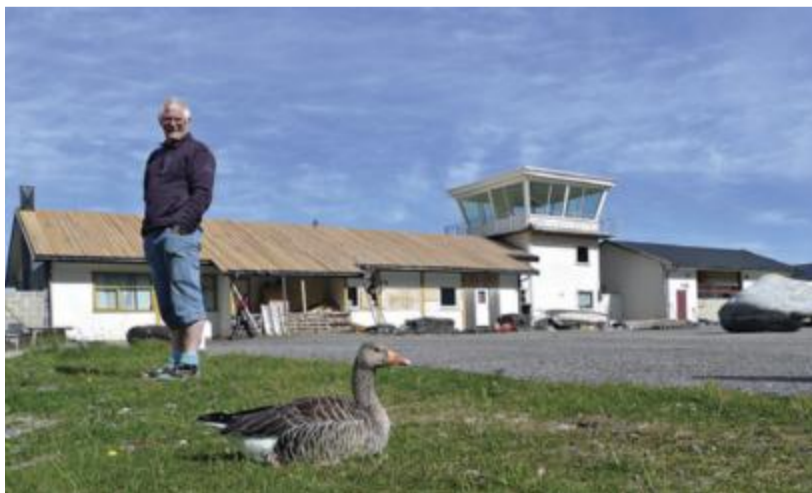
Andeby. Til familien hører dyr som kaniner, katter, hund, høns av forskjellige raser, indiske løpeender og andre ender av ulike slag.